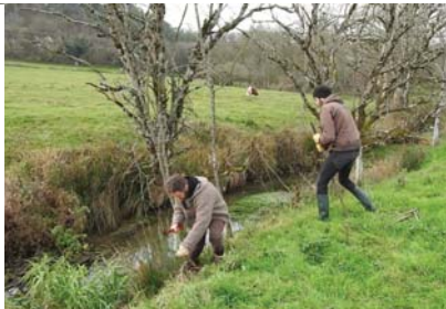
Bouturage de Saules, Véria

Première rivière de la région à être colonisée par une population pérenne, le Suran souffre d'un manque de boisements rivulaires assurant le gîte et le couvert à l'espèce. Depuis maintenant 8 ans, JNE – aux côtés du syndicat de rivière local - informe, sensibilise, accompagne les acteurs locaux (habitants et riverains, collectivités, agriculteurs...) et initie des actions (bouturage de saules, etc.) pour maintenir ces cordons boisés, gage d'une bonne cohabitation « Castor & Homme »