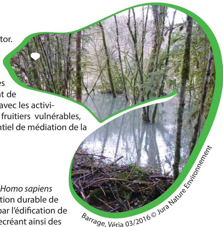
Barrage, Véria 03/2016

Vincent Dams : vincent@jne.asso.fr / 03.84.47.24.11