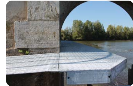
Passé à Castor, Truchère (71)

Dans sa progression, l'espèce est régulièrement amenée à s'installer sur ou aux abords du canal du Rhône au Rhin. Voies navigables de France et le castor doivent donc apprendre à cohabiter, à s'approprier ! Dole Environnement, l'AOMSL (Association Ornithologique et Mammalogique de Saône-et-Loire) et JNE accompagnent VNF pour une prise en compte réglementaire de cette espèce « parapluie », pour permettre la préservation de la biodiversité qu'elle côtoie et entretient localement.