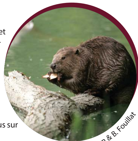
© F. Bruggman & B. Fouillat

Que la lecture de ce numéro "1" vous donne l'envie d'en savoir plus sur cette aventure, de la poursuivre avec nous et de la faire vivre ! Castordialement vôtre,